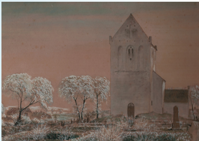
Kauslunde kirke 1881 H. J. Knudsen

Vi inviterer indenfor til en spændende aften, hvor Danmarks Nationalmuseum leverer en historisk gennemgang af kirken, heriblandt vores gemte klenodier. Alle er velkomne.